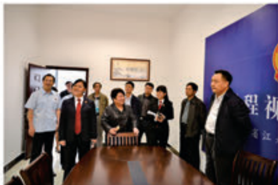
永州市委常委、政法委书记唐能武（右一）视察江永县人民法院。