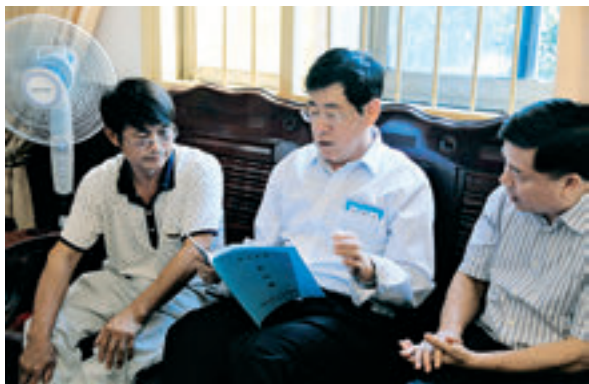
韩永文(中)在湘潭县谭家山镇人大代表活动室调研。

7月20日至21日，省人大常委会党组书记、副主任韩永文率省人大常委会办公厅、预工委、联工委、研究室负责人，赴湘潭市调研贯彻落实省委人大工作会议精神、加强基层人大工作和建设情况。