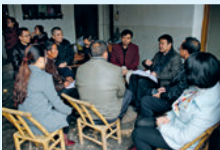
新田县检察院开展的党建扶贫“一进二访”活动。