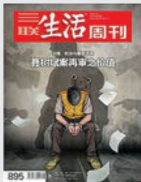
《三联生活周刊》第895期

7月28日，《网络预约出租汽车经营服务管理暂行办法》出台，作为分享经济的业态之一，网络预约出租汽车（网约车）终于获得合法的身份，拼车、顺风车出行方式也得到支持、鼓励。新政将于11月1日起实施。此前，经过了9个多月漫长的征求意见。交通运输部副部长在国新办发布会上说，支持网约车平台公司不断创新规范发展。 http://weibo.com/1905628462/E131RDNqw?c