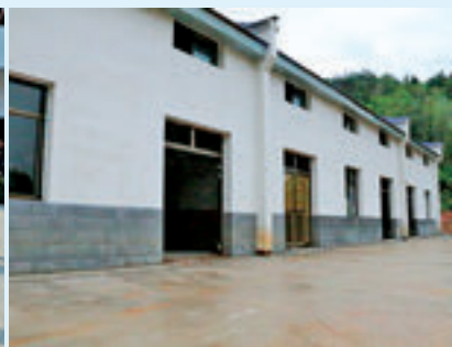
横许村危房改造项目。