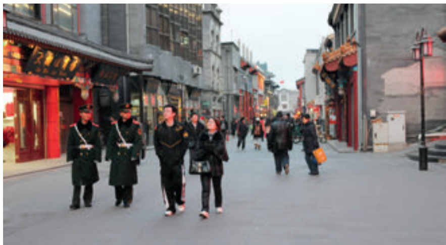
中央推出街区制，可以让选区之间不再有“墙”。

2月21日，中央公布了一份重磅文件，不仅“新建住宅要推广街区制，原则上不再建设封闭住宅小区”，还要求“已建成的住宅小区和单位大院要逐步打开。”