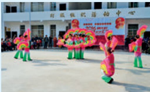
在新改建的村级组织活动中心，举办元旦文艺汇演。

准扶贫的特色之路。至今，完成了村级组织活动中心建设，村党支部被评为县“五星级服务型”党组织。安排 67 名干部与 67 户精准扶贫户结对帮扶，一户一策，按照个人意愿将每户按照“五个一批”工程进行分类，完成了投资 380 万的环村道路硬化，投资 300 余万进行危房改造、农田水利建设，投资 160 万建成了移动通讯塔和宽带电视等基础项目。成立农业合作社，采取“以奖代补，先干后补”，“集体出资，农户承包”等模式。建成了楠竹、生姜、高笋、金丝楠木等产业基地，加大教育培训力度，开展技能培训、知识讲座、“雨露计划”、设立专项基金、兴办农家书屋、举办文艺下乡等举措，不断改变村民“等、靠、要”思想，使贫困群众发挥自力更生精神，主动脱贫致富。2015 年人均收入 4300 元，比 2014 年提高 700 元。目前，一个充满活力和希望的新农村正在摘掉“穷帽子”、拔起“穷根子”、挖出“致富泉”，在脱贫致富的道路上开拓前进。