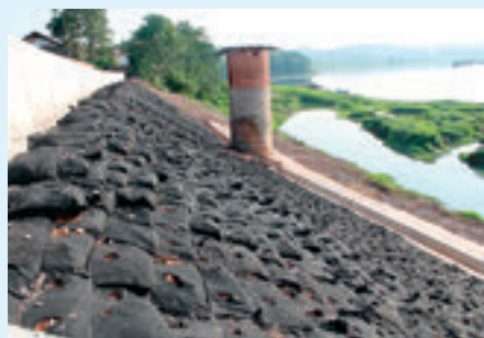
常宁市松渔居委会镉工业污染源治理工程河道护坡修整。