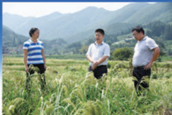
江永县委副书记、县长唐德荣（中）深入到源口瑶族乡调研指导香米产业保护和发展工作。

倾力改善民本民生，群众福祉展示了稳步提升的新景象。 民生保障全面加强，重点民生实事工作获评市先进。全年完成民生支出12.3亿元，占财政总支出的75%，全面完成了棚户区改造、“五小水利”等民生项目，精准扶贫全面推进。全县有10362名贫困人口脱贫，12个村实现整村脱贫，向上争取扶贫资金4448万元，增长112%；投资3000万元、全省唯一的夏橙资产收益扶贫项目落户江永，扶贫实际成绩绩效考核名列全省第1位。率先在全市开展“送法到家、教育帮扶”活动，群众安全感不断攀升，获评全省综治工作先进县。