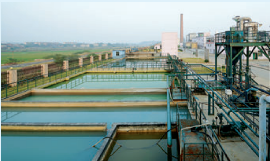
常宁市水口山八厂铅冶炼废水处理系统。

目前，该市已初步制定了 2016 年度实施方案，并配套了包括重金属污染防治及重点区域污染综合整治等十大类 177 个项目，项目的实施将进一步改善湘江衡阳段干流水环境质量。☑