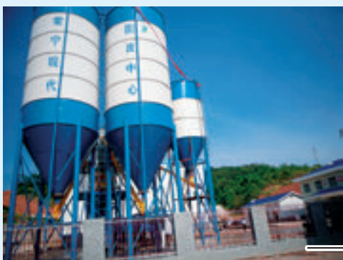
常宁市水口山地区历史遗留含重金属危险废物无害化处置一期工程。