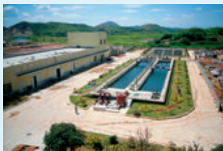
常宁市水口山经济开发区重金属废水深度处理循环利用工程。