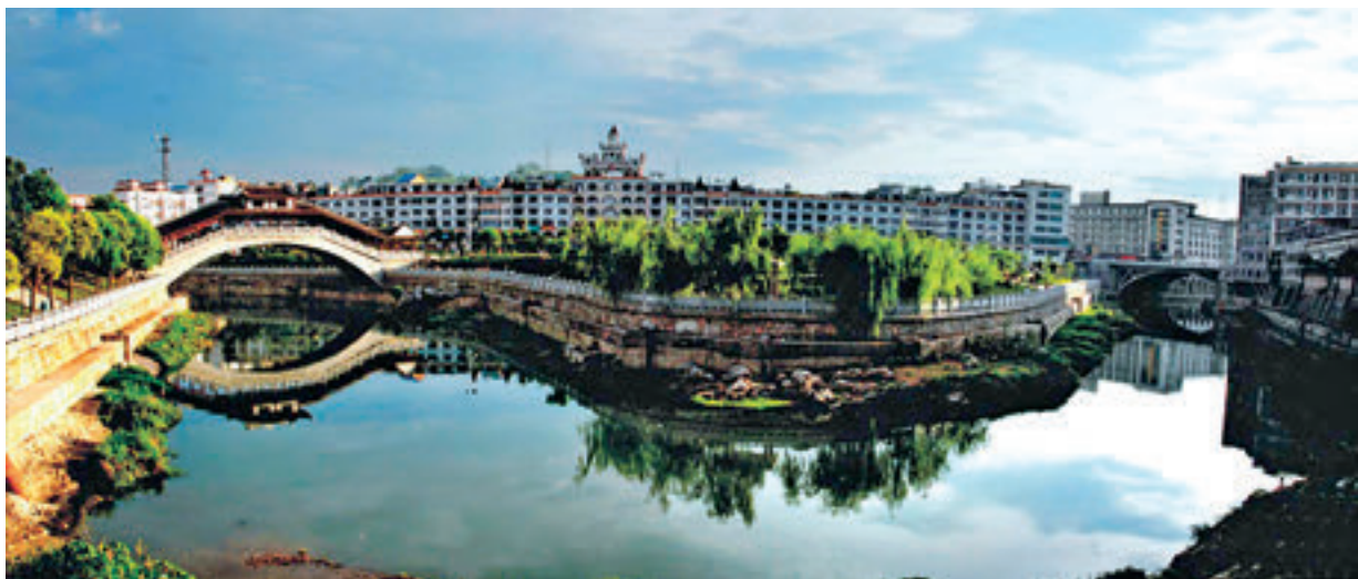
在涟源市连续三届人大常委会的持续跟踪监督下，涟水河重现碧水清波。

7月的一天，一个风和日丽的日子。笔者缓步来到蓝溪桥上，只见涟水河清波荡漾，小孩在河中嬉戏玩闹，老人在河边纳凉聊天，呈现一派温馨和谐的景象。