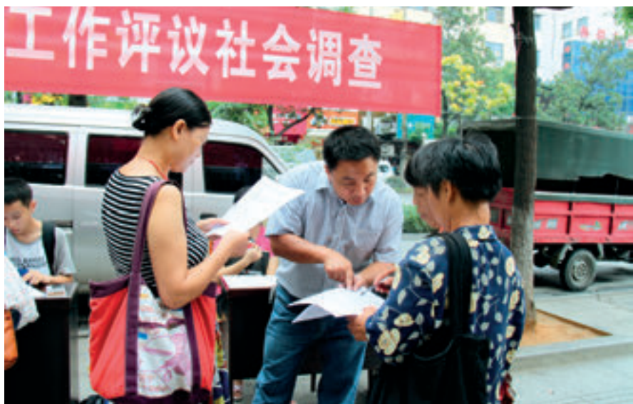
冷水江市人大常委会就食品安全专项工作评议工作开展社会调查，向群众发放征求意见表。