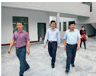
左图：新田县委书记唐军（中）走访慰问困难群众。