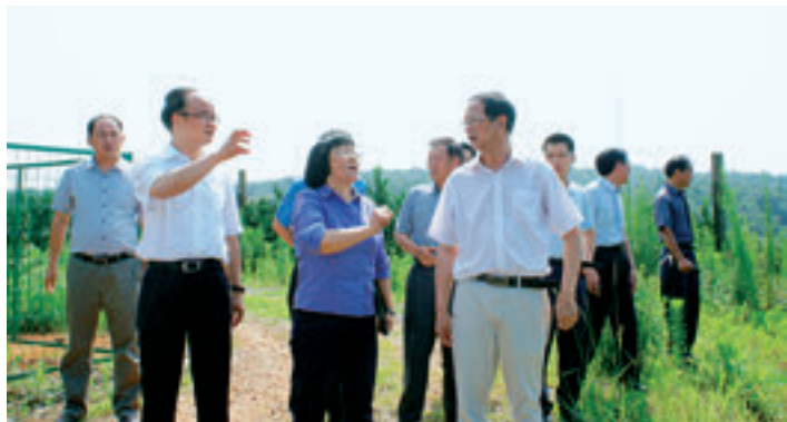
湖南省人民检察院党组书记、检察长游劝荣（左二）来永州调研。

盘点 2015 年，永州市人民检察院在党组书记、检察长文兆平带领下，凝心聚力，励精图治，铿锵前行，走过了不平凡的历程，收获了一串串成果。