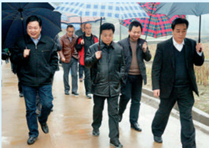
岳阳市委书记盛荣华（中）在平江县加义镇横许村视察和指导工作。

平江县加义镇横许村是一个典型的偏远、贫困、落后的山区“穷村”，共有 18 个村民小组，193 户 796 人，总面积 15328 亩。2014 年，该村人均纯收入 3230 元，精准扶贫户 67 户 222 人，低保户 33 户 47 人，五保户 10 人，因残疾、大病及自然灾害等导致无收入群众 34 户，62% 的房屋为土坯房，道路破烂、电力设施老化、网络信号薄弱、生活用水匮乏等“短板”问题突出。