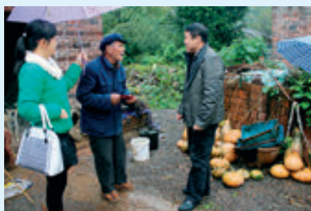
新田县检察院党组书记、检察长蒋长春（右）在扶贫点慰问群众。点