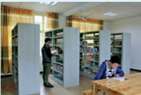
高标准的横许村农家书屋。