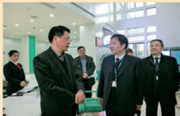
张家界市委书记杨光荣(左一)到国网张家界供电公司调研指导工作。

景区杆线入地和城市亮化工程、服务黔张常铁路等重点工程建设、开展“两个替代”服务新能源发展，“两改一同价”年减轻农民负担2000余万元。积极落实精准扶贫、大力开展“青春光明行”、供电服务“四进”活动，公司行风评议多年名列全市公共服务行业前列。圆满完成了党和国家领导人调研视察保障、“国际森保节”“国际乡村音乐节”“元宵灯会”等重大活动保电任务，受到社会各届一致好评。公司获得全国“文明单位”、“五一劳动奖状”、“厂务公开民主管理先进单位”、“模范职工之家”、“职工书屋示范点”和省、市的多项荣誉。