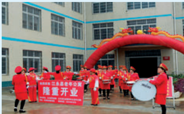
江永县社会福利中心老年公寓开业。