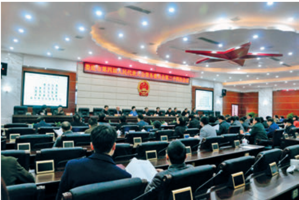
2016年2月2日，娄底市人大常委会会议审议立法听证工作制度等六项立法配套制度。