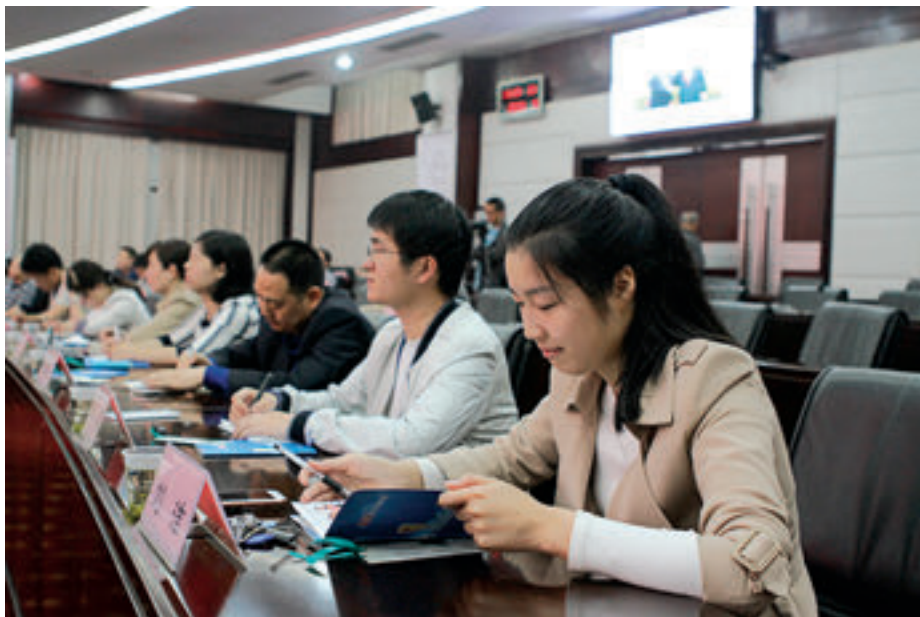
5月27日，岳阳市人大常委会机关开展道德讲堂活动，年轻干部正在认真听报告。

同时，市人大机关重视干部的对外交流，积极向市委提出对外交流的推荐意见，鼓励人大干部到党政机关和司法部门施展才干。10多年来，共向市委推荐交流处级干部8人，向中央部委、省直机关、市委推荐使用科级干部3人，这些干部以工作实绩赢得了所在单