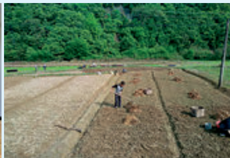
横许村村民正在种植生姜。