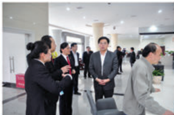
永州市中级人民法院党组书记、院长罗重海（中）深入到江永县人民法院调研指导工作。

江永县人民法院现有14个内设机构，下辖濂浦、桃川、黄甲岭、回龙圩4个人民法庭，在编在岗干警75人，其中本科以上学历70人，35岁以下青年干警占1/3，年均受理案件超过2300件。