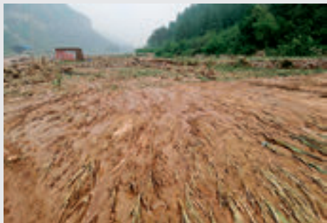
七里河沿岸被冲毁的庄稼。

截至23日9时，邢台死亡25人，失踪13人。“没能保护好人民群众生命财产安全，深感自责和内疚。”邢台市长董晓宇鞠躬道歉，承认灾情上报不及时、不准确，并启动追责程序。