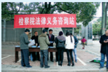
新田县检察院组织的法律义务咨询进社区活动。