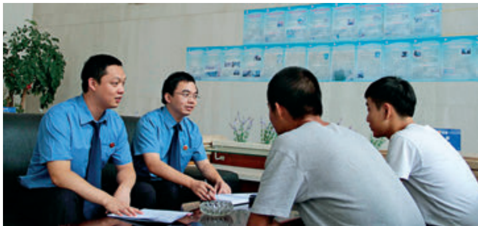
雨花区检察院检察官对当事人进行教育指导。

近年来，社会矛盾日益凸显并急剧增加，长沙市雨花区检察院坚持理性、人性化办案，诠释执法价值追求，彰显法治精神，有效化解了社会矛盾。