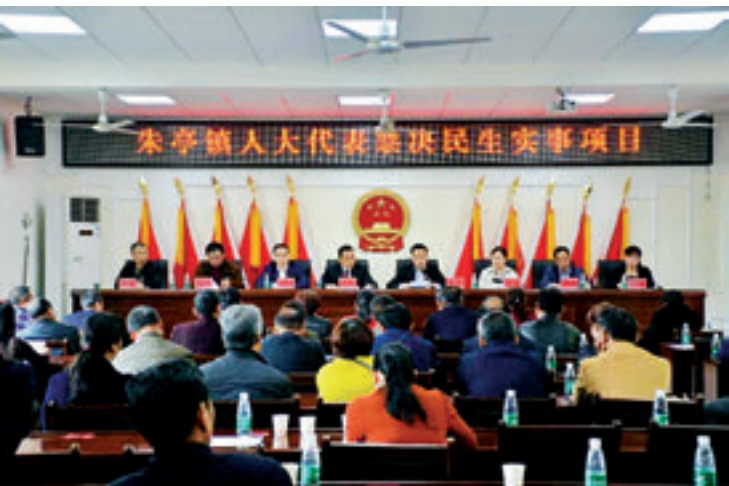
渌口区朱亭镇人大代表投票表决民生实项目。

株洲市民生实项目实行代表票决制工作，将在渌口区试点的基础上，用两到三年的时间，逐步推广到全市范围。