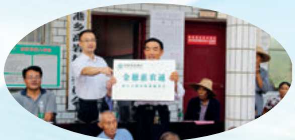
中国农业银行湖南省分行在行政村设立“金穗惠农通”服务点。