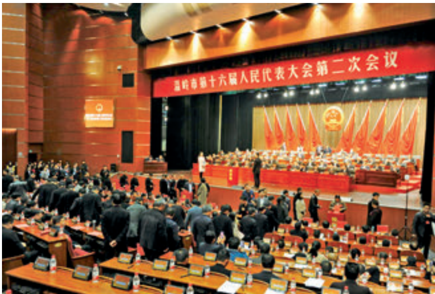
温岭市人大会议票决现场。

发轫于浙江宁海的力洋镇、大佳何镇的民生实项目代表票决制，十多年来，一直备受社会各界关注。2018年，浙江省11个设区的市、89个县市区、907个乡镇已实现票决制工作全覆盖。