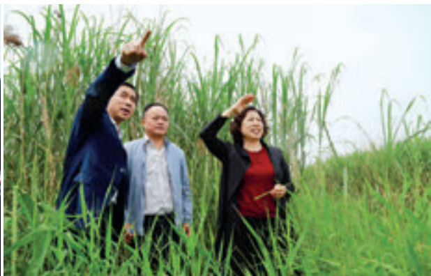
刘莲玉率执法检查组实地查看沅江南洞庭湖自然保护区保护情况。

根据2019年省人大常委会水污染防治“一法两条例”（《中华人民共和国水污染防治法》《湖南省湘江保护条例》《湖南省饮用水水源保护条例》）执法检查方案安排，4月23日至24日，省人大常委会党组书记、副主任刘莲玉率队赴益阳市，就“一法两条例”贯彻实施情况开展检查。省人大常委会秘书长胡伯俊参加检查。