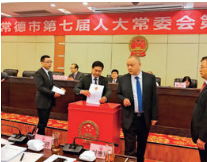
常德市七届人大常委会第十六次会议对市财政局、市教育局等8个单位审计查出问题整改情况进行满意度测评。

市人大常委会高度重视审计查出问题的整改落实，要求市人民政府落实整改责任，严肃追责问责，建立长效机