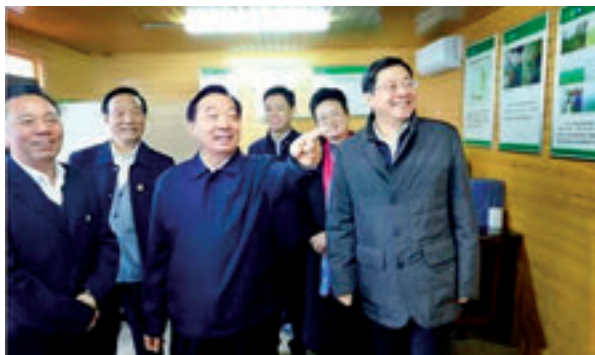
4月10日，王晨（前中）率执法检查组在岳阳检查长江岸线非法砂石码头整治复绿情况。

杜家毫在座谈会上表示，湖南将以此次执法检查为契机，对全省水污染防治工作进行全面“回头看”，切实用好执法检查成果，推动“一湖四水”系统联治取得新进