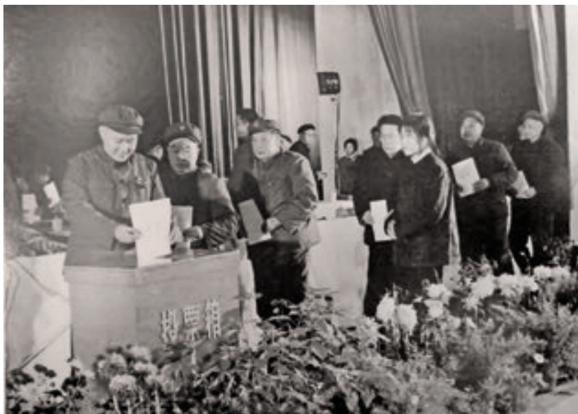
省五届人大二次会议依据地方组织法的规定，决定取消省革命委员会，设立省人民代表大会常务委员会，恢复省人民政府。标志着我省人民代表大会制度建设进入了一个新的发展时期。图为代表投票选举省人大常委会组成人员。

立法中，也为此问题感到困惑。截至 2019 年 3 月，我省现行有效的省本级法规 197 件，其中实施性立法约占 60%；设区的市级法规 91 件，也多为实施性的，对这些法规，如进行查重检测和清理评估，照抄照搬上位法的问题将会凸显。有的法规四五十条，真正管用、可操作、有地方特色的就十几条甚至几条，还要经过人大常委会三次审议，有时立法者和执法人也分不清这些立法内容源于何处和处于什么位阶，往往就简单地以实施地方性法规来代替国家法律的执行。如此这般浪费大量人力物力的立法与执法，肯定是不严肃不规范甚至会有严重的后果。而这部实施细则，开宗明义规定不重述上位法的具体规定，涉及少数民族选举的问题依照选举法规定办，真是难能可贵。当今的许多地方立法都不敢如此理直气壮地作出类似规定，有些法规议案的说明尽管讲法规草案不重复上位法的规定，也时常是名不副实。地方立法就应当是在法定权限内，细化、补充国家法律规定，或者探索性、创制性地自主立法，以保障国家法律在本行政区域的贯彻施行，保障法制统一原则的落实，而不是通过地方立法搞国家法律的宣传，更不能通过地方立法造成地方性法规取代国家法律的误判误区。当年这些规定所展现的理念，至今仍然管用实用，它就是科学立法所要求的反映客观规律与立法规律、依法立法所要求的依照法定权限与程序立法的生动展示。