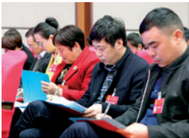
代表们认真审议民生实事项目。

因此，对征集到的民意进行甄别，让其真正成为代表决策的正当性基础和重要来源，就需要发挥代表联