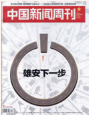
《中国新闻周刊》2019年第12期