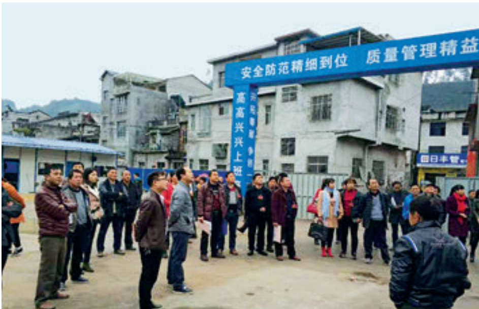
2018年12月7日，高桥镇人大代表视察民生项目。

决，投入资金1500万元，建成了日处理500吨的污水处理池，有效解决了全镇2万人的生活污水，得到了群众的支持和赞同。象市镇投入60万元，建成了日处理垃圾8吨的压缩站一座，可覆盖17个村146个村民小组。