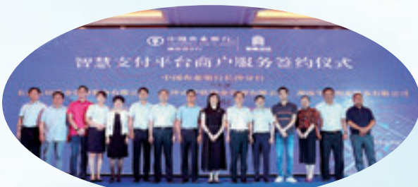
中国农业银行湖南省分行与长沙物业联盟签署“智慧支付平台”协议。

履行社会责任的担当银行。 湖南分行倾力免收小微企业7项承诺类及12项顾问类费用，2018年小微企业贷款余额351亿元，净增16亿元，连续多年实现“三个不低于”监管要求。大力实施金融精准扶贫，在40个贫困县（区）贷款余额392亿元，比年初净增52.6亿元；通过精准扶贫贷款带动服务贫困人口21.1万人，累计向2.18万建档立卡贫困户发放贷款6.13亿元。湖南分行先后荣获“湖南省金融机构支持地方经济发展目标管理奖”“湖南省社会主义新农村建设突出贡献奖”“全国金融系统企业文化建设先进单位”“第四届中国银行业最具社会责任分行”“最具品牌价值银行”等称号。