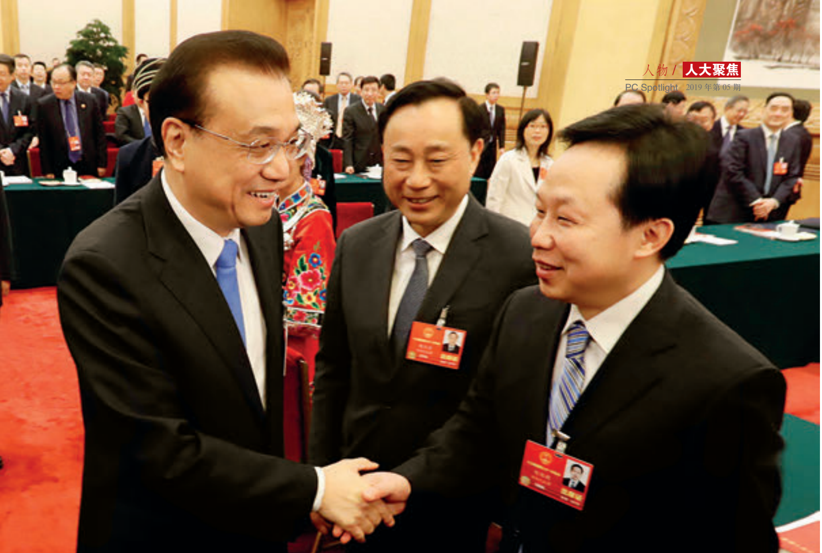
2018年3月12日，李克强总理和刘维朝握手，听取了其关于教育工作的建议。