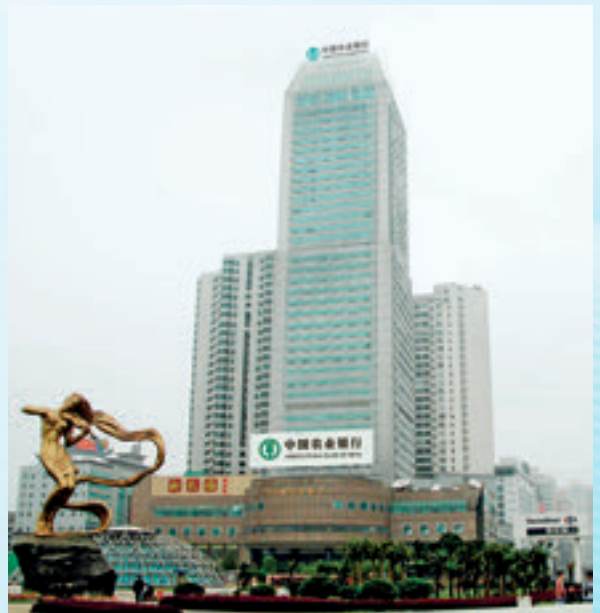
中国农业银行湖南省分行办公大楼。

满足市民需求的品质银行。 湖南分行业务范围已延伸至投资银行、基金管理、金融租赁、人寿保险等领域。深入推进“智慧城市”“智慧乡村”战略工程，推广智慧政务等八大场景金融品牌，将金融服务嵌入百姓生活的方方面面。加快建成智能化、场景化、一体化的渠道体系，线下深推机器替代人，建设以“超级柜台”和自助服务为主、以人工服务为辅的轻型网