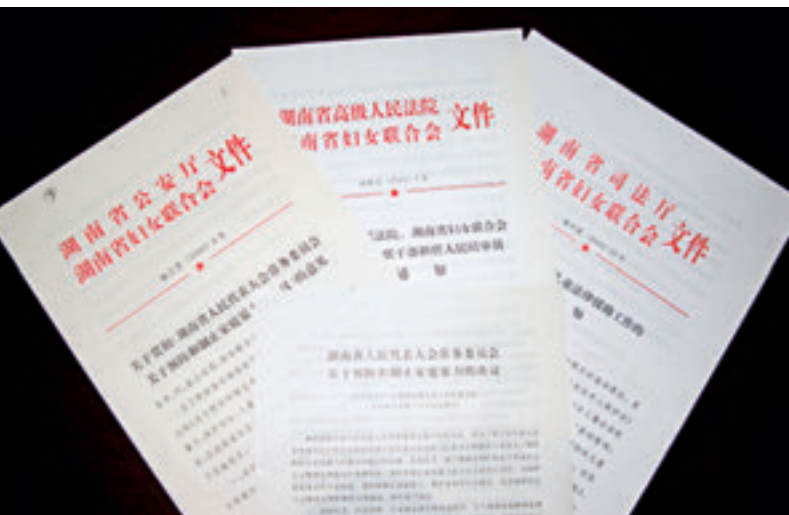
2000年3月，省人大常委会率先制定《关于预防和制止家庭暴力的决议》，首次将家庭暴力作为法律术语写进立法。

核心价值观提出以前，湖南就充分发扬了“心忧天下、敢为人先”的湖湘精神，在省人大常委会出台的一些精神文明领域的立法中，许多规定都与核心价值观的内在要求一脉相承。如：2000年3月，为了保护家庭成员的合法权益，预防和制止家庭暴力，维护家庭和社会稳定，省人大常委会率先通过了关于预防和制止家庭暴力的决议，该决议