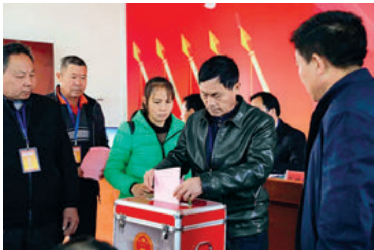
茶陵县马江镇人大代表投票表决民生实项目。

“市人大常委会党组班子成员要高度重视该项工作，主动谋划、积极参与，加强调查研究，适时总结经验，加大宣传力度，营造良好舆论氛围，确保民生实项目代表票决制在我市稳步推进，形成株洲经验。”2月19日，株洲市人大常委会党组第三十二次（扩大）会议听取了“一区八乡镇2019年开展民生实项目代表票决制试点工作安排情况”的汇报，对在株洲逐步推开民生实项目代表票决制作出安排部署。会议决定，在渌口区的区乡两级开展试点，在其他县市区各选择一个乡镇开展试点。民生实项目实行代表票决制工作，将在渌口区试点的基础上，用两到三年的时间，逐步推广到全市范围。