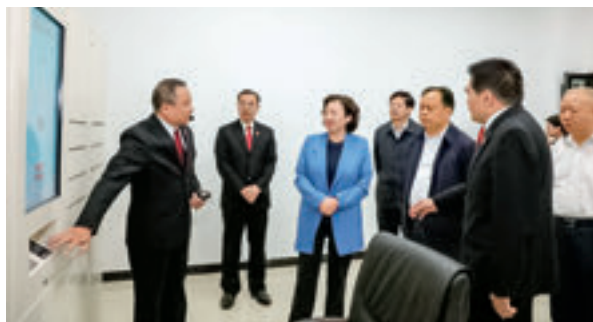
调研组一行在诉讼材料收转发e中心观看演示。

刘莲玉强调，全省各级法院要深入学习贯彻习近平新时代中国特色社会主义思想，增强“四个意识”，坚定“四个自信”，坚决做到“两个维护”，不断夯实新时代法院工作的思想基础。要坚守人民法院的初心使命，始终把维护公平正义作为价值追求，切实保护当事人合法权益。要着眼提升审判质效，着力提高队伍的政治素质，增强法官的斗争精神、奉献精神、工匠精神，确保法官队伍政治上过硬、业务上精通、纪律上严明。全省