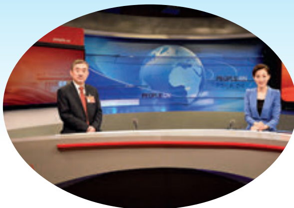
2019 年 3 月 13 日晚，十三届全国人大代表、湖南省教育厅党组书记、厅长，省委教育工委书记蒋昌忠（左一）做客人民网演播室，表示要书写人民满意的教育新答卷。

从“没学上”到“上好学”的跨越。 新中国成立初期，全省小学教育净入学率仅 20% 左右。70 年来，“有学上”的任务已经完成，“上好学”的愿景正在逐步变为现实。实行义务教育免试就近入学，切实保障进城务工人员子女享受同等受教育权，三类适龄残疾儿童少年入学率达到 92% 以上，107 个县市区通过义务教育基本均衡的国家认定。全面取消普通高中招收择校生政策，取消高考鼓励类加分项目，杜绝降分点录，顺利启动新高考综合改革。扩大农村和贫困地区学生上重点大学比例，2012 年以来，三大专