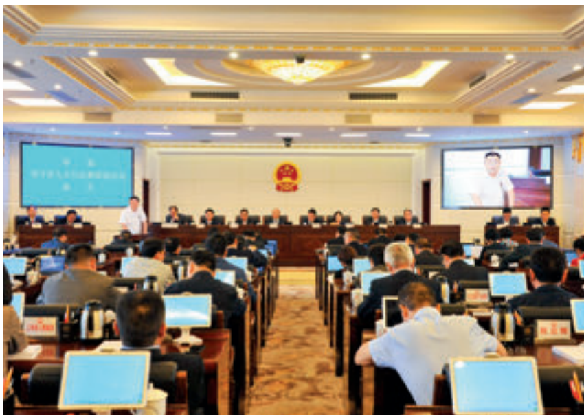
8月30日，在常德市七届人大常委会第二十四次会议上，部分在常德的省人大代表向常德市人大常委会组成人员述职。

活动，密切与群众和选民的联系，收集群众意见、建议 200 余条，推动解决了一批群众反映强烈的问题，得到群众的赞扬和认可；安乡县建立人大代表定期坐班接待选民制度，依托 53 个代表联系群众工作室，累计接待选民 500 余人次，登记各类意见、建议 200 多条，推动解决各类问题 173 件；津市市全面开展市、镇人大代表联系选民活动，已有 429 名市、镇人大代表联系走访了 6200 多位选民。