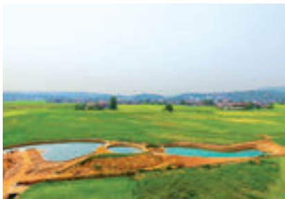
雪峰山村“五结合”环境整治项目一角。