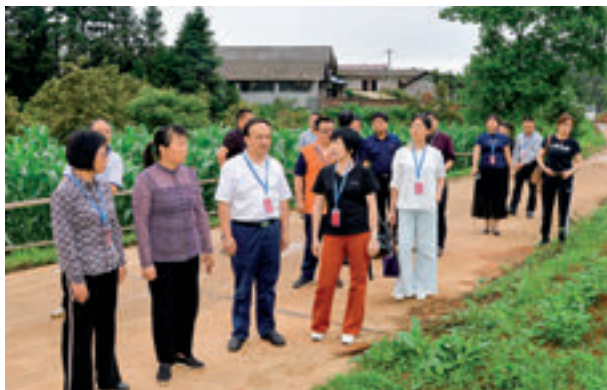
安化县人大常委会组成人员视察人大代表助力脱贫攻坚示范企业。

一是议决程序由“概念式”向“条文式”转变。自1981年1月县八届人大常委会第一次会议审议通过《安化县人民代表大会常务委员会几项工作制度》以来，常委会分别就健全人大议决机制进行了探索，制定和完善制度20多项。直至2018年12月，县十七届人大常委会第十五次会议审议通过《安化县人大常委会讨论、决定重大事项的规定》，常委会决定重大事项工作程序由此迈入制度化、规范化轨道。二是审议质量由“泛淡化”向“效能化”转变。为避免审议过程中出现的“偏题发言”“表决式审议”等现象，常委会健全了会前初审、分组讨论、会中发言工作制度。会前精心组织常委会组成人员深入开展集体调研，组织法律专家就草案进行把关