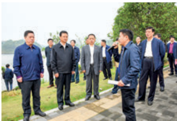
岳阳市人大常委会组成人员集中视察山体水体保护情况。

人大不问过即止，一届接着一届干；政府不止于答，一年接着一年办，一幅水墨丹青山水画卷呈现在岳阳人民面前，这就是专题询问的效力所在。