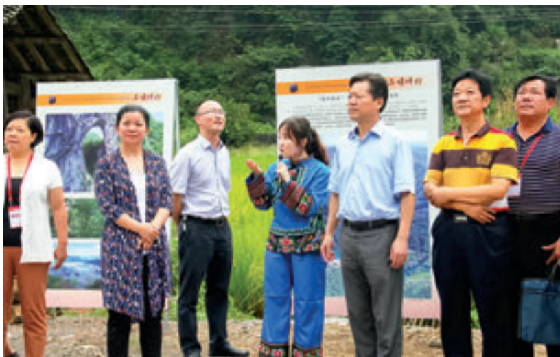
张家界市委书记、市人大常委会主任魏正贵（右三），市人大常委会党组书记、副主任余怀民（左二）调研旅游扶贫工作。

1999年，张家界市举办了中国生态环境游湖南张家界国际森林保护节、全国中老年职工门球赛、中国京剧票友节、张家界世界特技飞行大奖赛等重大活动，对城市建设管理、旅游接待等提出了更高要求。