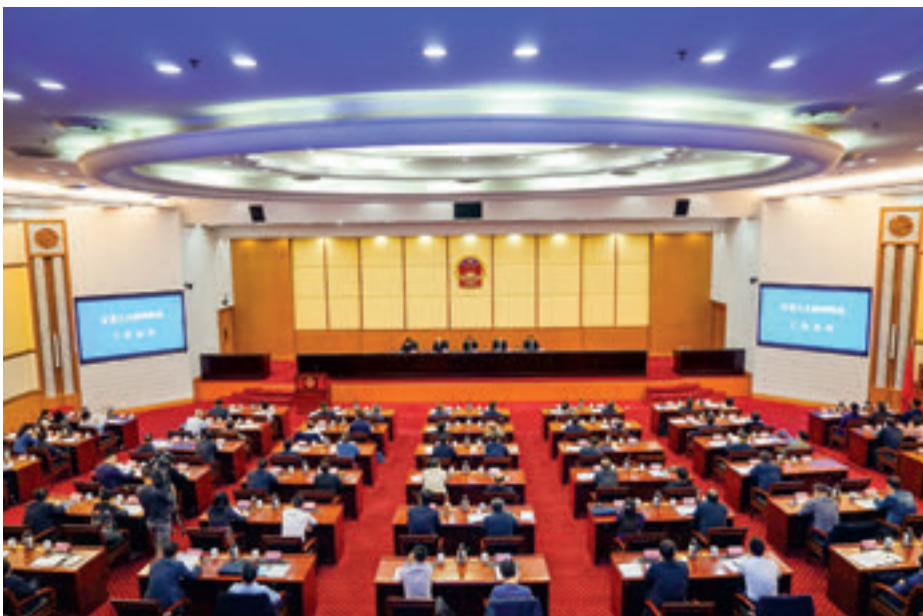
10月25日，全省人大新闻舆论工作会议召开。

10月下旬，全省人大新闻舆论工作会议、《人民之友》办刊工作座谈会、全省人大系统新闻舆论干部学习班接连举行、举办。这些密集的动作，吹响了奋力书写新时代全省人大新闻舆论工作新篇章的集结号。