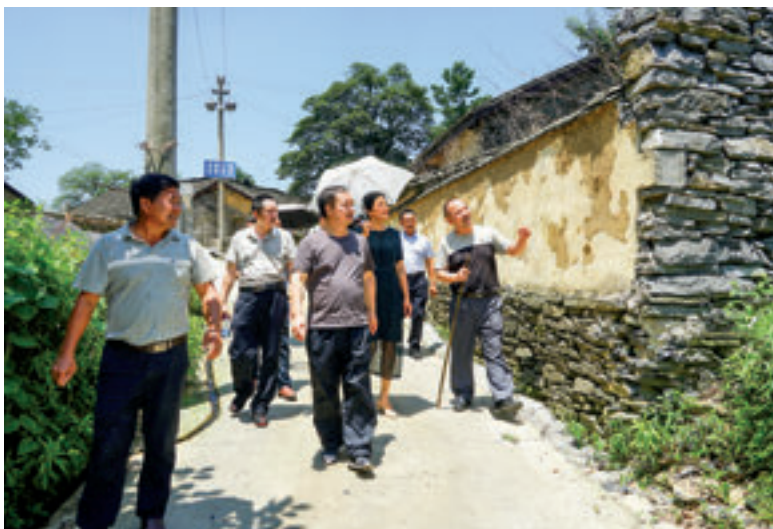
6月26日，凤凰县人大常委会组织州、县、乡三级人大代表到山江镇凉灯村调研古村落保护情况。

凤凰县人大常委会创新代表工作机制，改进代表工作方法，为代表履职强底气、添元气、接地气、鼓士气，推进代表工作展现新气象。