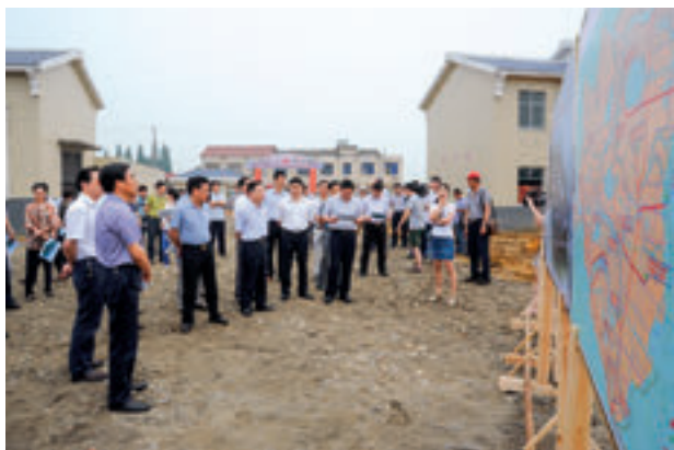
2014年6月，全市农村饮水安全工作现场推进会在汉寿县召开。

监督工作更加经常、更加系统。“常德环保世纪行”活动第一年，以极具前瞻性的眼光，围绕“还我蓝天、还我碧水、还我绿地”主题，在《常德日报》设置专版，在电视台、电台开辟专栏，拉开了大力宣传关停、关闭污染企业的帷幕。此后，“常德环保世纪行”坚持一年一个主题，紧扣水、气、土等关键领域，把亲水、净水、护水活动推向纵深。其中，2004年刊发的《水——我们的生命之源》《水库搞精养，水质在恶化》等通讯报道，对全市认清污染危害、揭露污染事件、解决环境问题起到了积极的舆论监督作用。