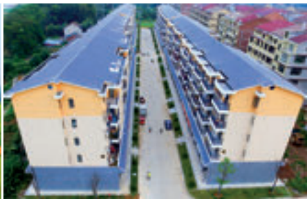
易地扶贫搬迁牛潭河安置点。