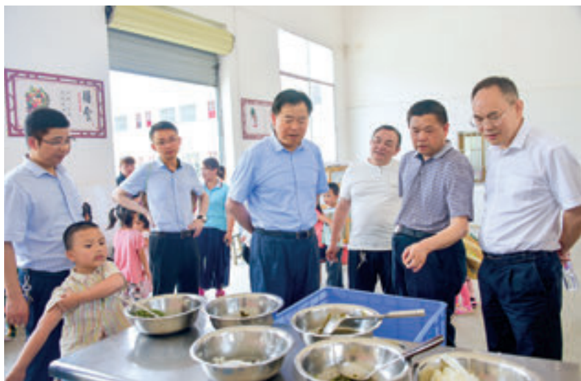
怀化市人大常委会党组书记、副主任石希欣（右四）带队深入通道侗族自治县调研食品安全法律法规的贯彻实施情况。

怀化市人大常委会以民生关切为监督发力点，通过开展执法检查、改进监督方式方法、实行监督“回头看”、建立问题清单制等方式，不断提升人大监督效能。