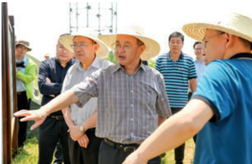
2019年6月，市人大常委会组成人员开展西洞庭湖湿地保护立法调研。

常德市人大常委会始终坚持以保护西洞庭湖为样本，持续推进水环境保护和综合治理，探索出了一条“常德道路”，形成了一套“常德模式”。