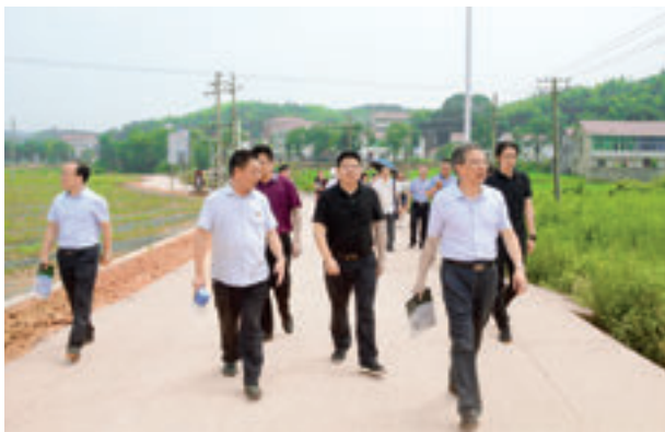
株洲市渌口区人大代表对民生实事票决项目“建设四个美丽乡村”情况开展视察。

十一届人大二次会议，这一阶段，代表行权履职有了法律保障，人大代表工作进入健全规范阶段。