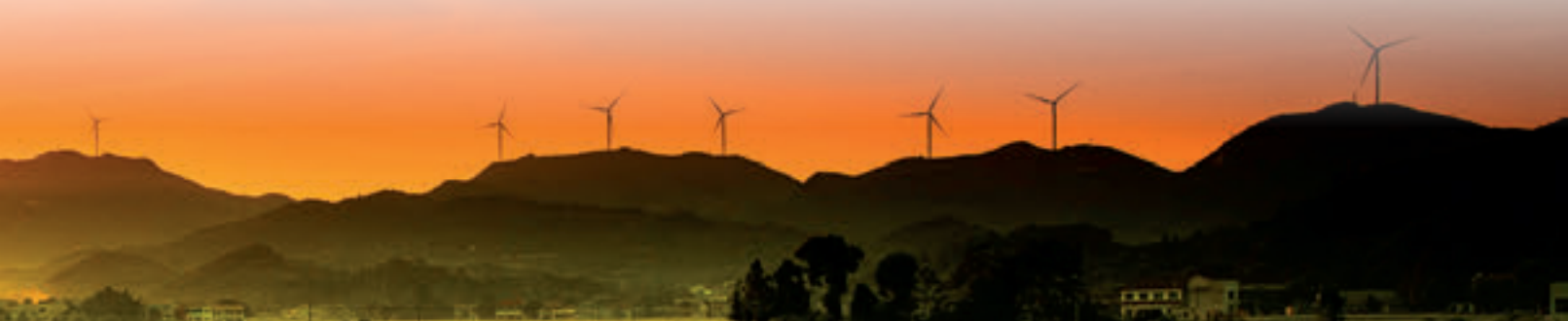
晚霞中的邱家仑风电场。