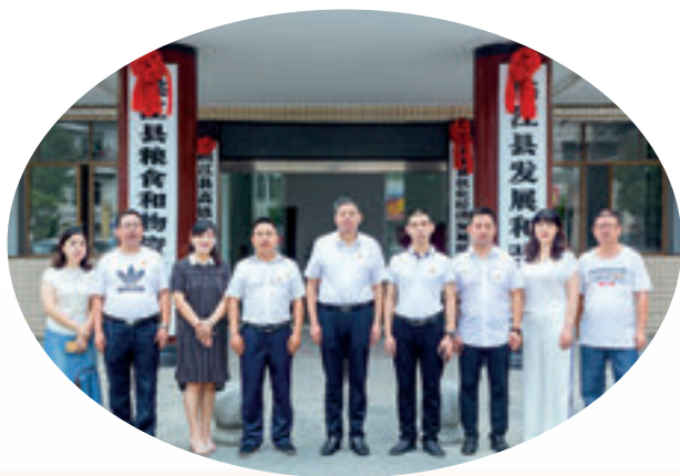
团结奋进的桃江县发展和改革局领导班子。

农业基础设施建设大力推进。2016 年以来，完成高标准农田建设 6.9 万亩，除险加固水库 100 座，维修改造山塘 600 口，修建林区三级公路 200 公里，