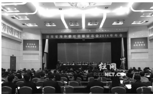
(湖南省海外侨社团联谊总会 2014 年年会现场)

联谊总会会长王钦贤在会上作工作报告。指出，在过去的一年里，阿联酋湖南商会、老挝湖南商会、非洲中华总商会、世界华文媒体集团、马来西亚常青集团、马六甲中华总商会、马六甲中华大会堂、印尼雅加达中华中学旅港校友会等侨团侨企分别承办了“亲情中华—魅力湖南”侨心艺术团赴阿联酋迪拜、老挝、南非、马来西亚吉隆坡、马